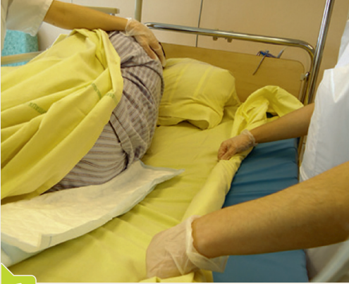
1 Tourner le patient en position latérale, du côté opposé au soignant.