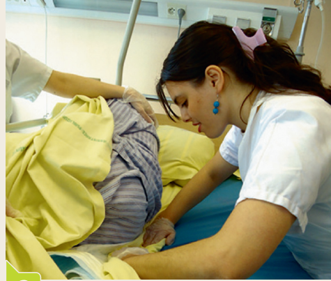
2 Rouler le drap de dessous et l'alsè le long du dos du patient.