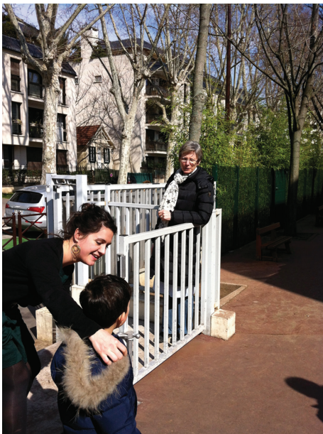
FIG. 8.6. Une ATSEM à l'accueil (à la porte extérieure de l'école).