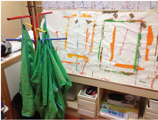
FIG. 8.7. Mobilier et matériel (espace peinture).