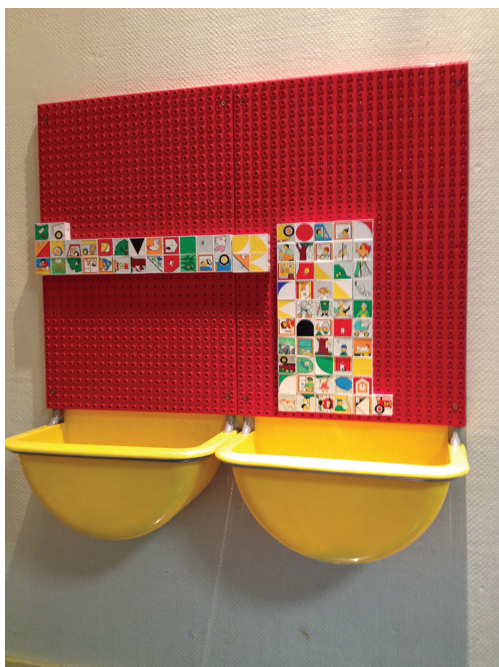
FIG. 8.11. Légo® vertical.

Pour les autres ateliers de graphisme, de déguisement, d'encastrement, de lecture, de musique, etc. l'ATSEM préparera le matériel adéquat, sur l'emplacement réservé toujours en fonction des consignes de l'enseignant et de la pédagogie proposée.