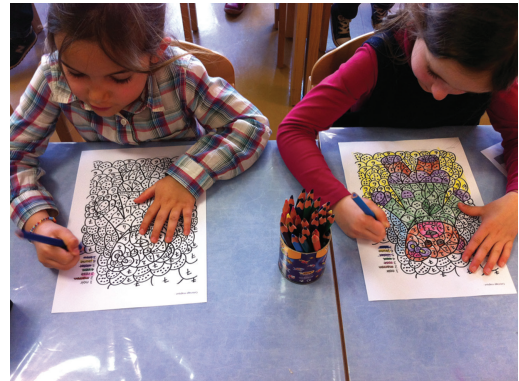
FIG. 8.10. Espace graphisme et écriture.