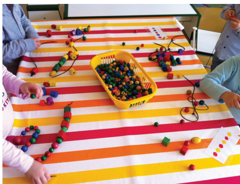
FIG. 8.14. Enfilage de perles en petite section.