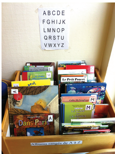
FIG. 8.13. Espace bibliothèque de la classe.