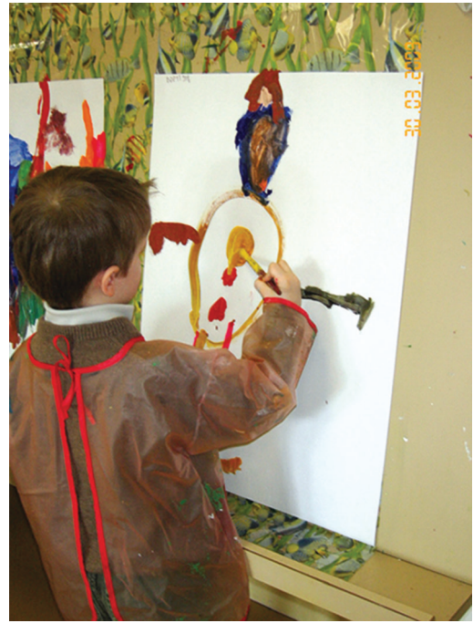
FIG. 8.8. Espace peinture (moyenne section).

Source : J. Gassier, Méga Guide – Concours ATSEM , 4 e édition, 2015.