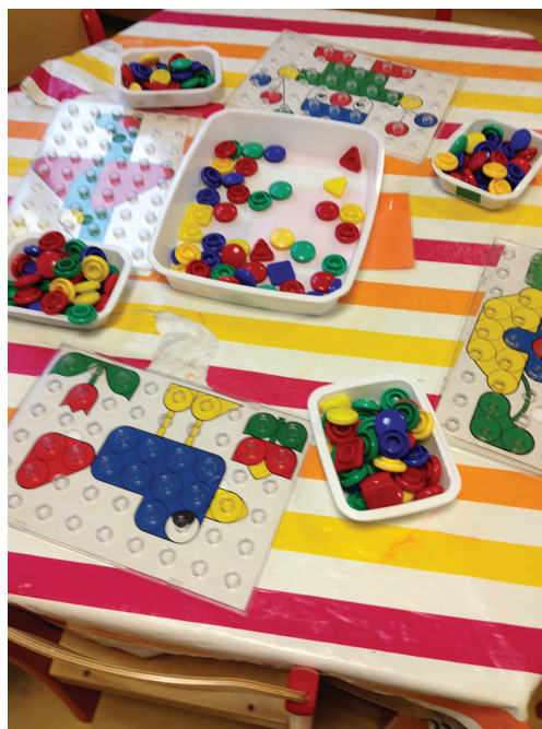
FIG. 8.12. Maxicolore®.