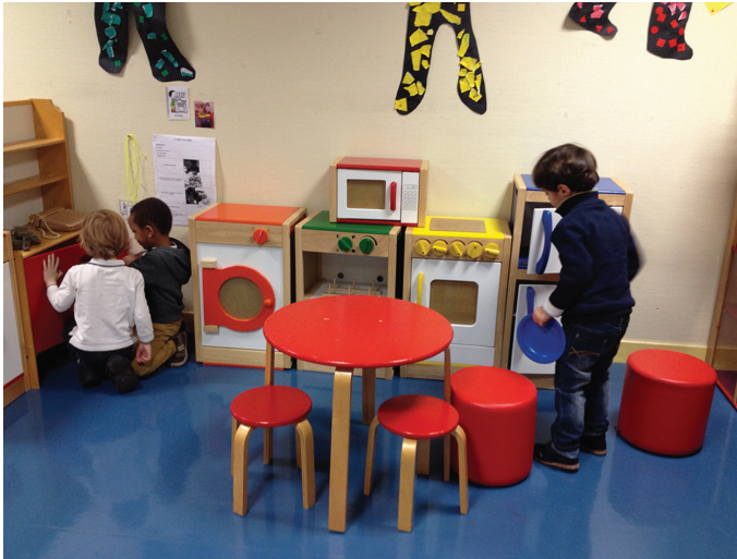
FIG. 8.15. Jeux d'imitation petite section.