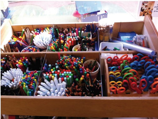
FIG. 8.9. Rangement du matériel de graphisme.

Source : J. Gassier, Méga Guide – Concours ATSEM , 4 e édition, 2015.