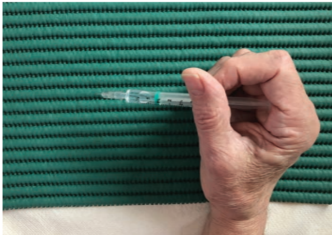
FIGURE 10.3. Seringue à moitié vide, pression du piston avec méta-P1.