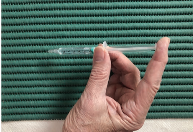
FIGURE 10.2. Lorsque la seringue est pleine, pression avec pulpe de l'index.