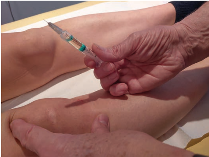
FIGURE 10.1. Purger la seringue seulement lorsque l'aiguille de mésothérapie est en place.

Il faut prendre garde à la longueur des seringues de 10 ml, car pour l'adaptation sur certains appareils, une certaine longueur est nécessaire (il en est de même pour les seringues de 2 ml).